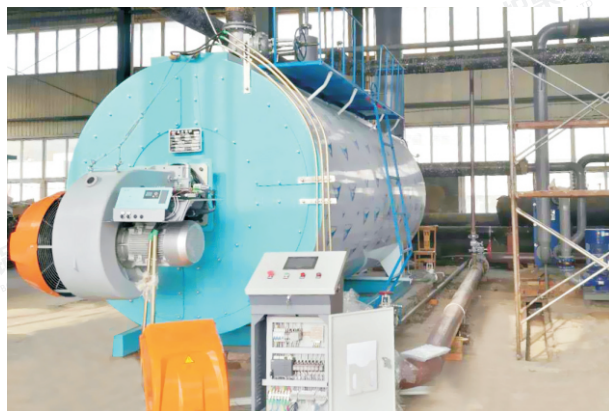
2017.12-5.6MW CWNS5.6-95/70-Q 内蒙古东源水务科技发展有限公司