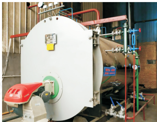
2017.06-2×1.4MW CWNS1.4-95/70-Q 湖南-中铁十五局集团三公司兴县制梁场