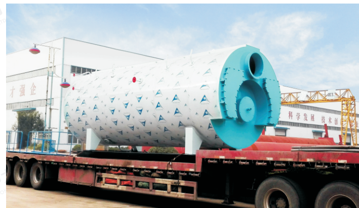
2017.11-6吨 WNS6-1.6-Q 鹤壁市双力橡塑有限公司