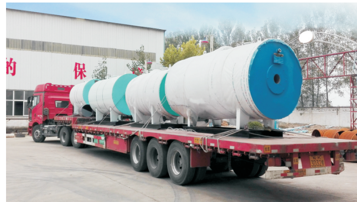
2017.02-4×2.8MW WNS2.8-0.7/95/70-Q 武汉中州大酒店