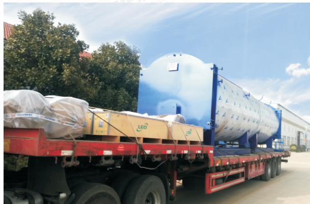
2017.07 -7MW WNS7-1.0/95/70-Q 新疆伊犁师范大学