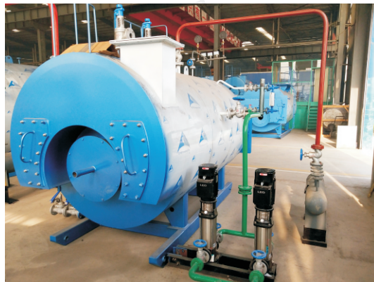
2016.09-4吨 WNS4-2.5-Q 山东圣运化工有限公司