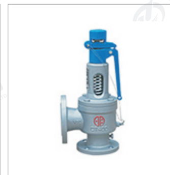
郑州宇明球墨铸铁 弹簧全启式安全阀