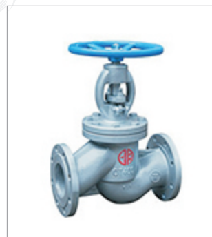
郑州宇明球墨铸铁 截止阀